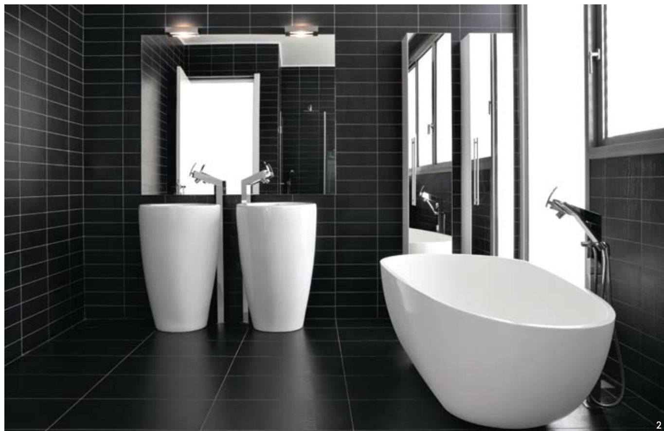
1 | במעקות נעשה שימוש במספר מחברים מינימלי כדי לשמור על המראה הנקי והלא עמוס 2 | חדרי הרחצה רוצפו וחופו באריחי קרמיקה שחורים, שעל הרקע שלהם בולטים האביזרים הלבנים 3 | השטיח והמצעים הלבנים בחדר ההורים משלימים את הקו המודרני והמינימליסטי

הרצפה היא פרקט עץ מלא הממשיך את הריצוף במסדרון. השטיח הלבן והמצעים באותו צבע משלימים את הקו המודרני והמינימליסטי. שני חדרי הרחצה בקומת המגורים עוצבו בסגנון דומה. הם רוצפו וחופו באריחי קרמיקה שחורים, שעל הרקע שלהם בולטים האביזרים הלבנים - אסלות, כיורים ואמבטיית פרי סטנדינג. בחדר הרחצה של הילדות נמתח חלון זכוכית חלבית מהרצפה עד התקרה והוא מעצים את הניגוד שבין השחור והלבן על ידי האור הבהיר והמסונן שהוא מכניס לחדר.