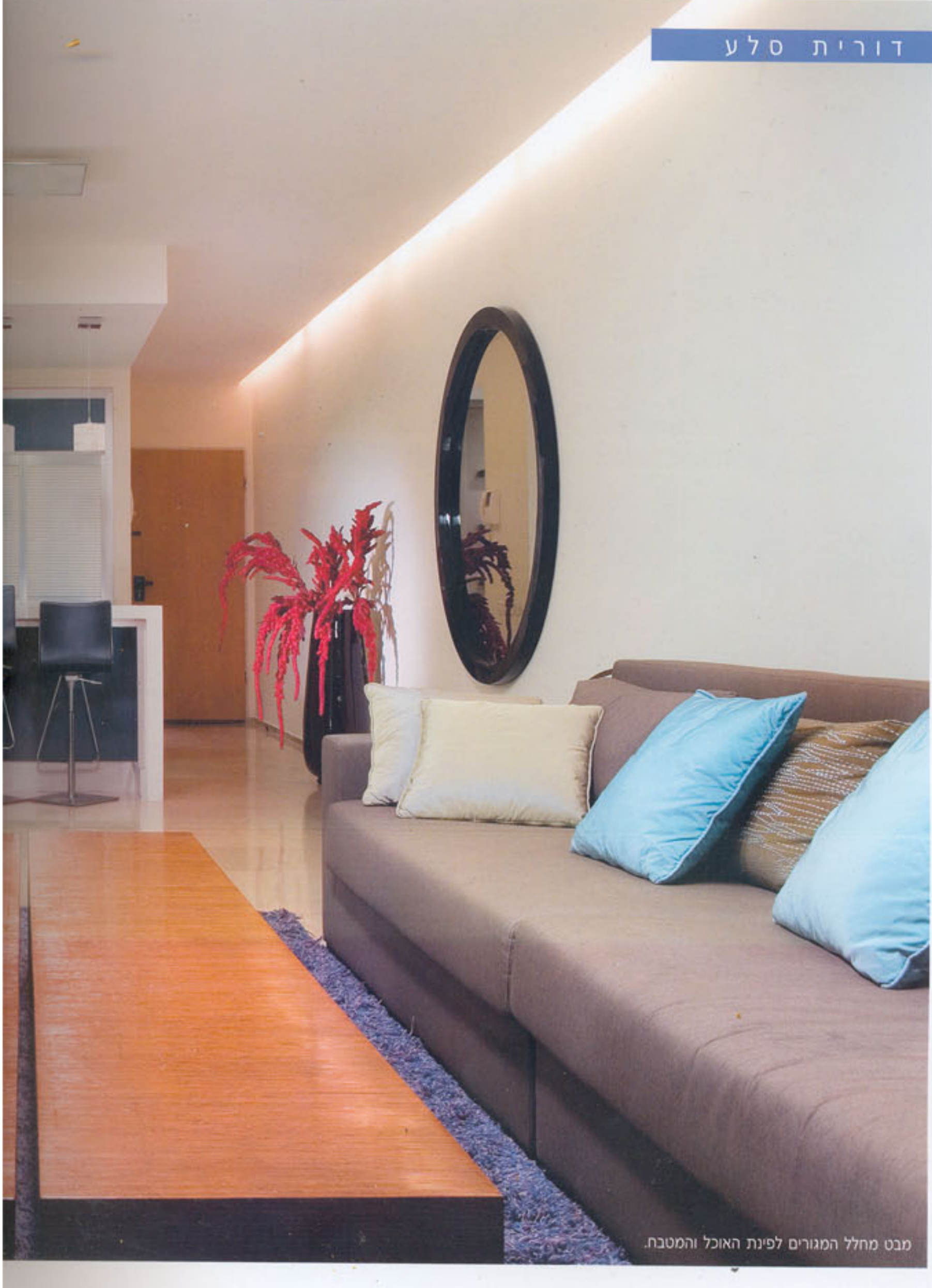
מבט מחלל המגורים לפינת האוכל והמטבח.