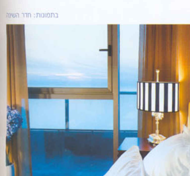
בתמונת: חדר השינה

מותקנת אמבטיית עיטוי גדולה אשר סביבה חופתה באריחי פסיפס צבעוניים המשמשים כרקע בולט לכיור לבן, מעוצב כסירת "קנו".