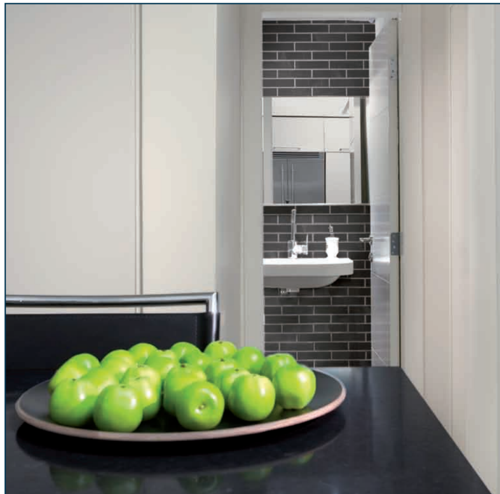
בתמונות: ריבוי חפצים ואלמנטים, ללא תחושת דחיסות

כמו כן, החפצים – ובעיקר האדריכלות והפרופורציות של הבית – מייצרים מעין תחושה של "ביתו הוא מבצרו". למרות ריבוי החפצים, אין בחלל תחושת דחיסות, אלא עושר ומגוון שמאפשרים למצוא עניין בכל זווית מבט, "כך שלא יתעורר הצורך לפנות החוצה".