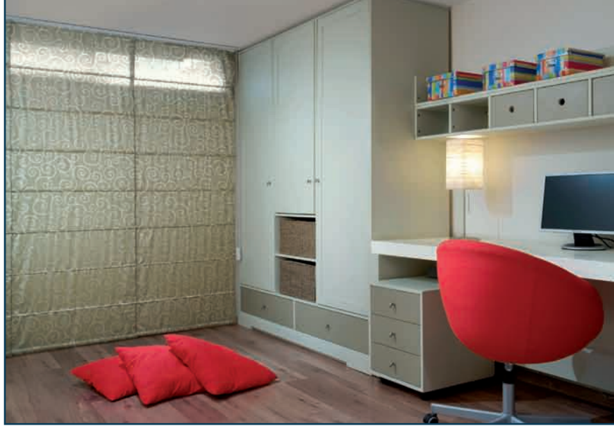
בתמונות: חדר ילדים ורצף הרמוני בחדר הרחצה