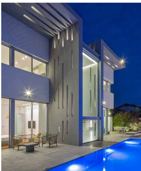
דיהוט גן: גנים ושושנים

בפנים הבית רצפת הפרקט מתחילה למעשה בתקרה, יורדת וגולשת לכל גובהו של הקיר וממשיכה בתוואי תנועה ברור עד גרם המדרגות שמוקם מול חלון רחב ידיים