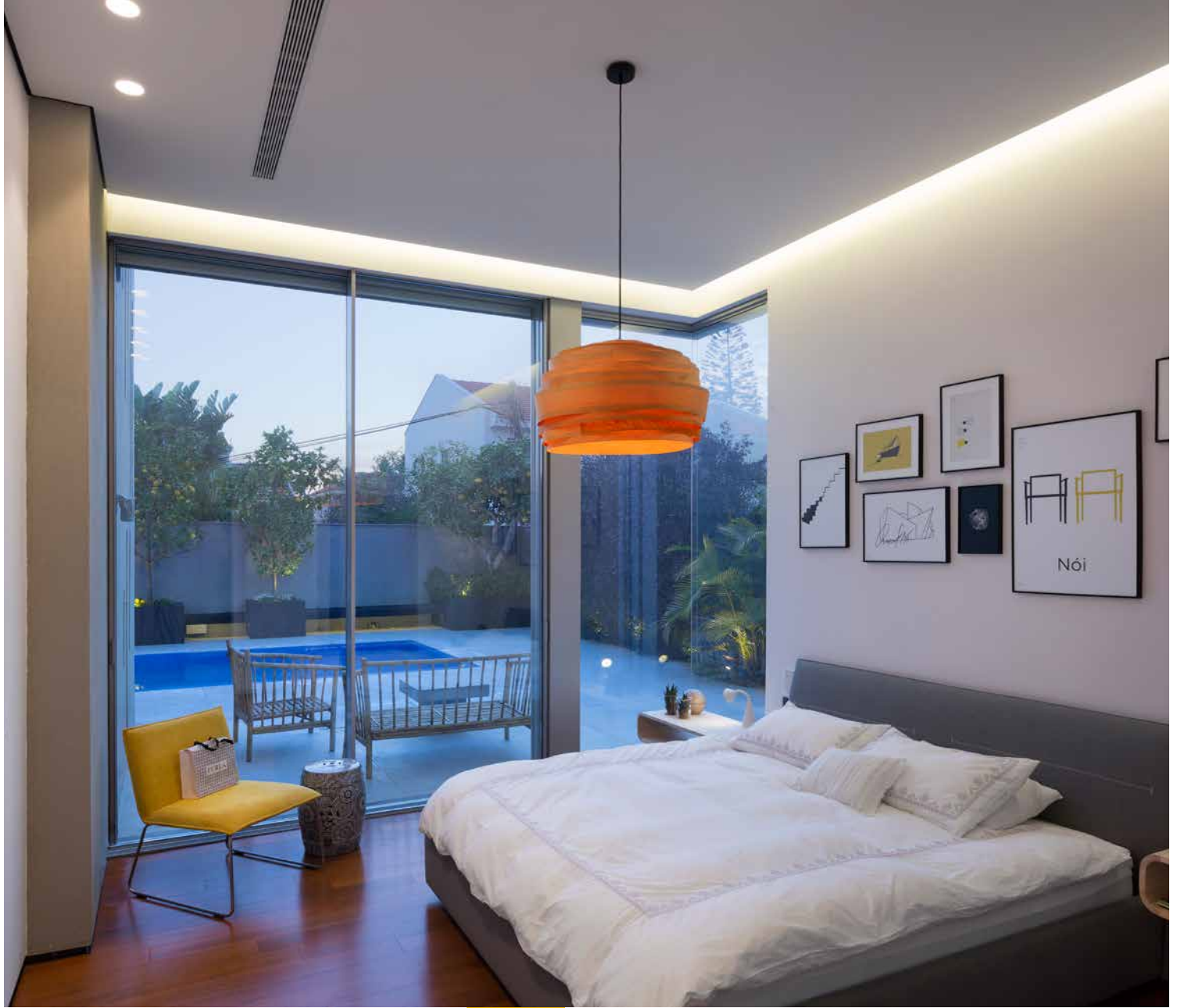
חלונות אלומיניום: קליל

לשלוש יחידות הכוללות אזור שינה וחדרי רחצה. בנוסף, הוקצה מקום המשמש כחדר עבודה מרכזי לכל המשפחה. הבילויים המשפחתיים מתקיימים בקומת המרתף שהוכשרה במיוחד לכך.