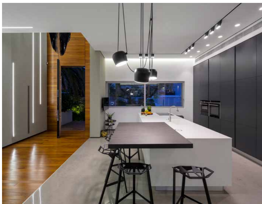
מוצרי חשמל: סימנס, משטח קוריאן: ארקדה, תאורה: דורי קמחי, דלת כניסה: APERTO

בקומת הכניסה, מעברו השני של שביל רצפת הפרקט, מתוך חשיבה עתידית על הימנעות משימוש במדרגות, מוקמה יחידת הורים גדולה ומרווחת, וגם ממנה יש יציאה ישירה לברכת השחייה, בנוסף לשתי היציאות הנמצאות בסלון ובפינת האוכל.